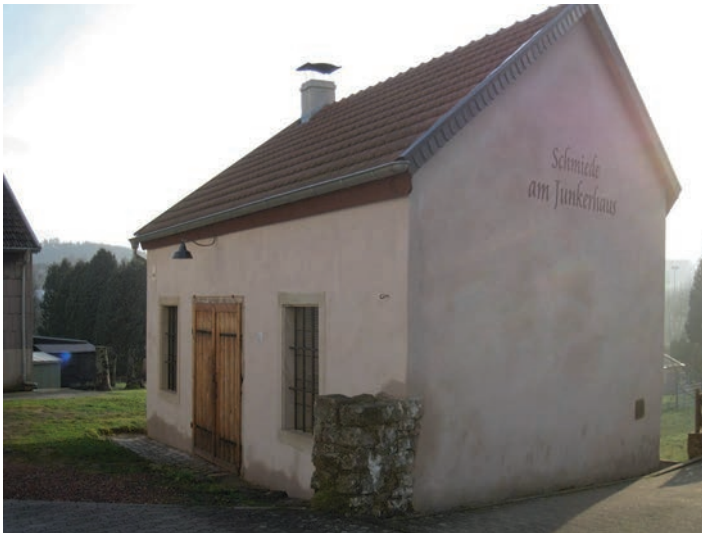
Schmiede am Junkerhaus in der Eisenbahnstraße

Die Aktivitäten des Vereins sind vielfältig. Während im Junkerhaus in der Eisenbahnstr. 22, Vorträge und Veranstaltungen wie der Kaffeeklatsch stattfinden, sind Arbeitsräume im Haus Hoppstädter in der Rettenstr. 2 für laufende Arbeiten genutzt. Dort befinden sich die Sammlungen des Vereins (Fotos, Zeitungsausschnitte und Dokumente) sowie eine umfangreiche Bibliothek mit Literatur zu geschichtlichen Themen.