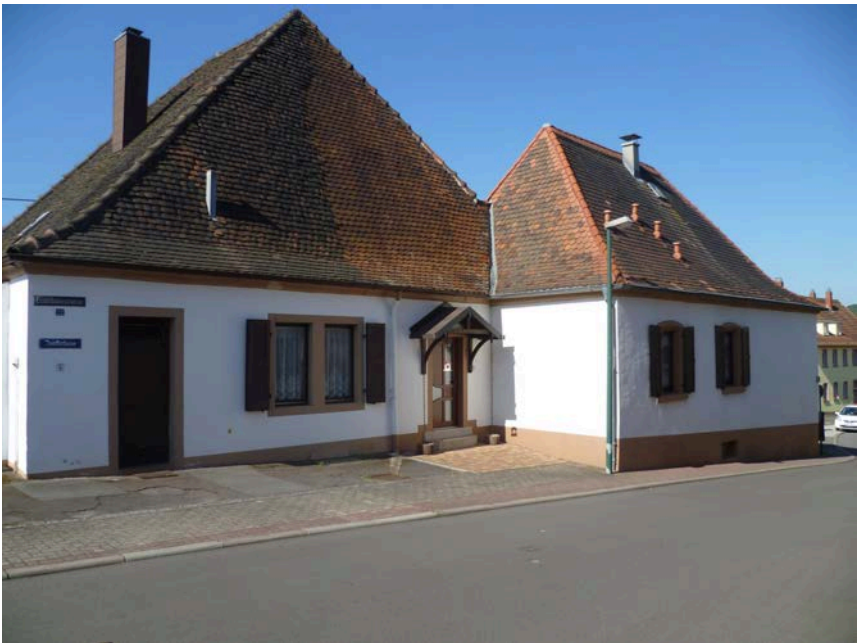
Junkerhaus in der Eisenbahnstraße