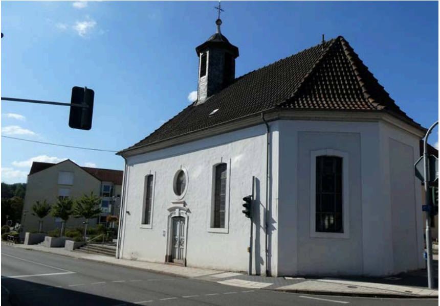
Stengelkirche, Ecke Homburger/Rombachstraße