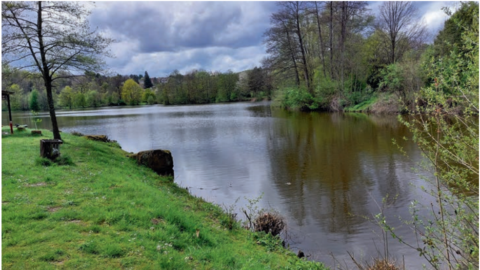
Weiher des Angelsportvereins mit der Möglichkeit eines Rundganges