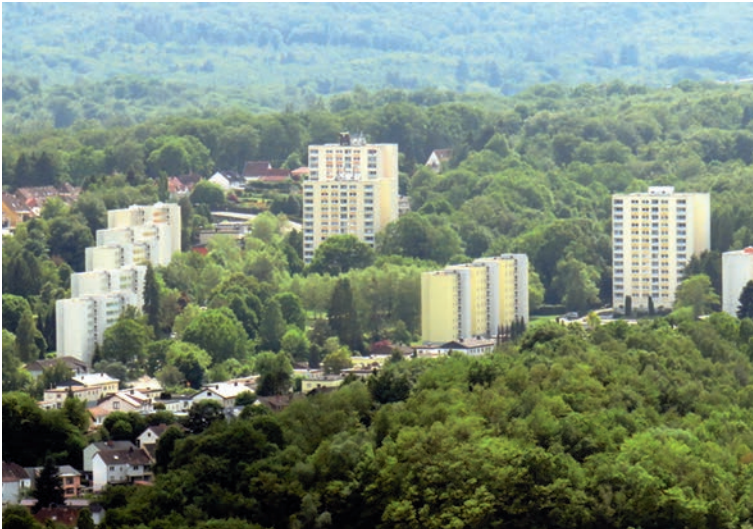
Blick über Wellesweiler, Winterfloß