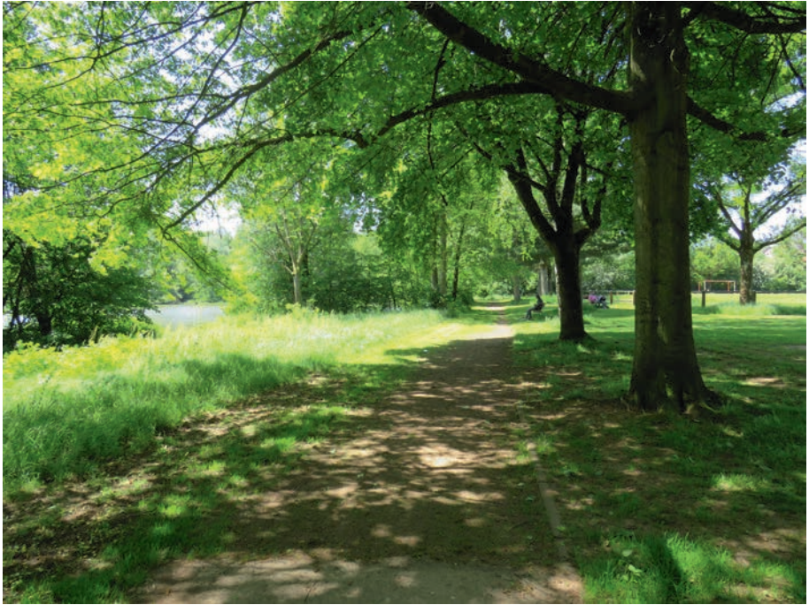
Parkanlage am Weiher