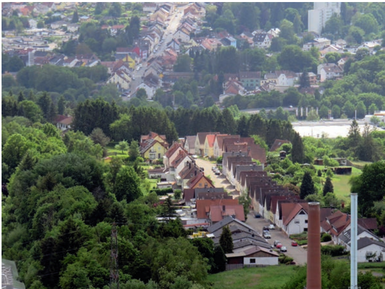
Blick über Wellesweiler, Rettenstr. und Bgm.-Regitz-Str.