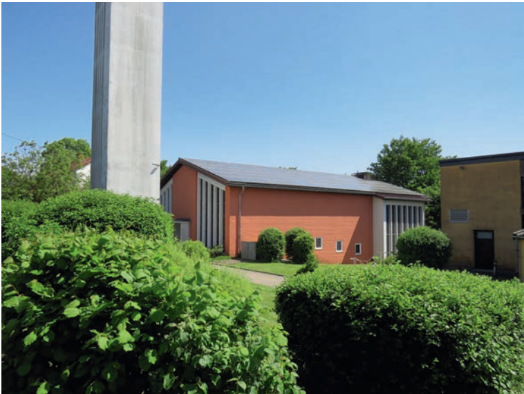
Evangelische Paul-Gerhardt-Kirche in der Ernst-Blum-Straße