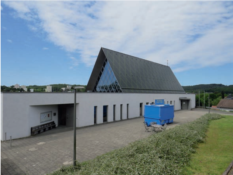
Katholische Kirche mit Gemeindezentrum in der Meißstraße