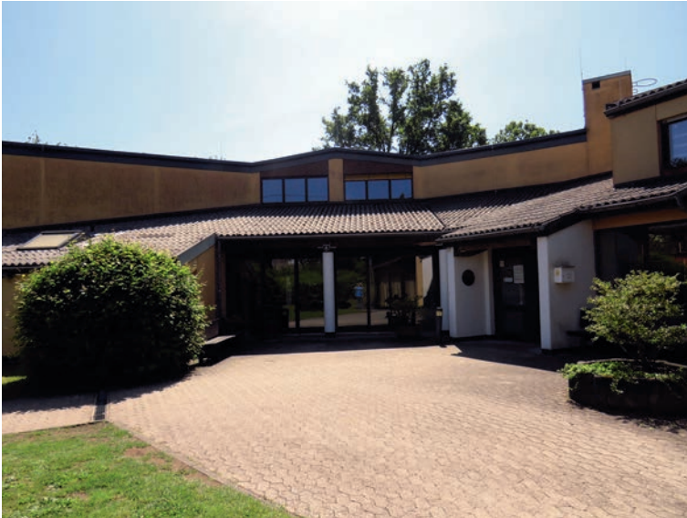
Evangelisches Gemeindezentrum an der Paul-Gerhardt-Kirche in der Ernst-Blum-Straße