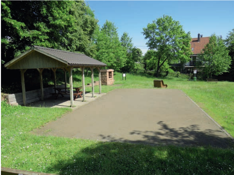
Blick auf den Bouleplatz am Köttenbrunnen in der Bgm.-Regitz-Straße