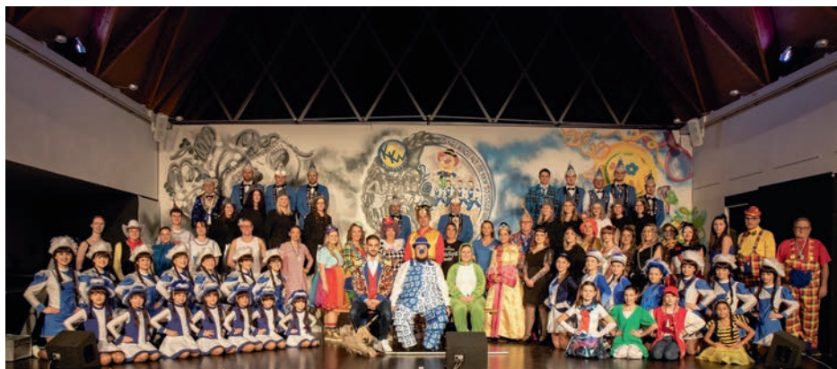
Text und Foto: Nicolas Schneider

Auch hinter der Bühne gibt es beim KKW viele Möglichkeiten aktiv zu werden. Neben den karnevalistischen Veranstaltungen beteiligt sich der KKW auch an vielen Veranstaltungen in Wellesweiler. Jeder ist herzlich willkommen. Ob als Mitglied oder als Gast bei den Veranstaltungen, denn beim KKW heißt es immer Faasenacht mit Herz.