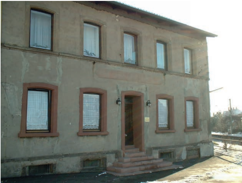
Haus Hoppstädter mit Bibliothek, einem Archivraum und Arbeitsräumen für die Familienkunde in der Rettenstraße 2

Wellesweiler Arbeitskreis für Geschichte, Landeskunde und Volkskultur e.V.